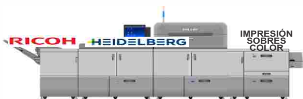
RICOH 9110 IMPRESION HASTA 400 GR / HASTA 33X70CM