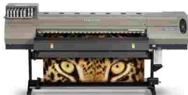
PLOTTER DE IMPRESIÓN RICOH