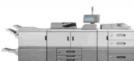
RICOH 8100 IMPRESION NEGRO HASTA 300 GR