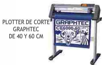
PLOTTER DE CORTE GRAPHTEC DE 40 Y 60 CM