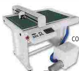
CAMA PLANA CORTE Y TRAZA SAGA