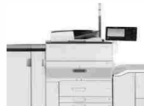
RICOH 5100 FULLCOLOR HASTA 350 Gs. 32x47Cm